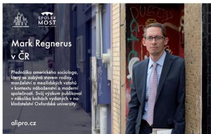
České Budějovice 30. 3. | 18:00 | sál Nár. památkového ústavu | Senovážné nám. 6

Akce se uskutečnila ve středu 30. 3. 2022 od 18:00 v sále Národního památkového ústavu, Senovážné náměstí 6.