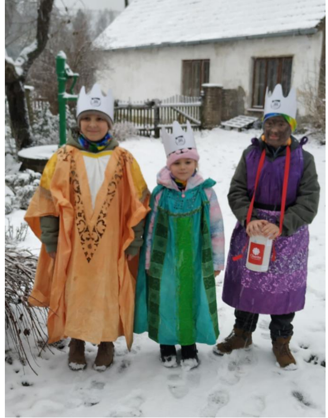
Některé z tříkrálových skupinek v Suchdole n. L.